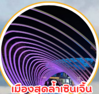
เมืองสุดล้าเซ็นเจิ้น

02 005 9588 | 088 931 4394 | www.feeldeetravel.com