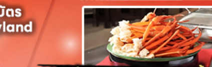
บุฟเฟ่ต์อาหารเย็น + ชาปู 1 มื้อ

Air Asia บินตรง นาริตะ เครื่องลำใหญ่ 370 ที่นั่ง