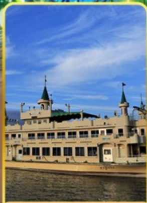
ล่องเรือทะเลสาบโทยะ