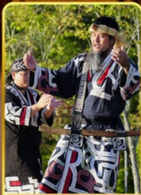
พิพิธภัณฑ์โอนู