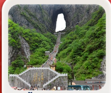
"กำประตูลิ่วหวง"