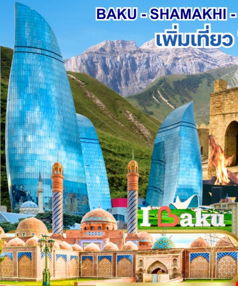
Masjed Imamzadeh Ibrahim