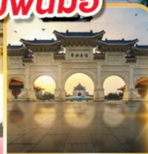
อนุสรณ์เจียงไคเชค