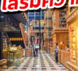
ร้านไอศกรีมมียาฮ่า