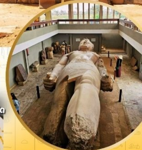
*เงื่อนไขเป็นไปตามที่บริษัทกำหนดเท่านั้น*