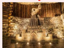
เหมืองเกลือวิลิชก้า