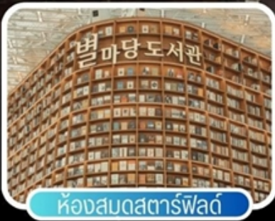
ห้องสมุดสตาร์ฟิลด์