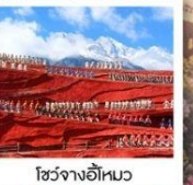
โซ่วจางอีหมว