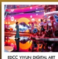
EDCC YIYUN DIGITAL ART