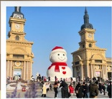
ดึกตาหิมะยักษ์