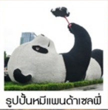
รูปปั้นหมีแพนด้าชหลมี