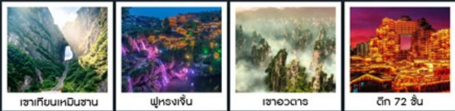
เขากิยเนหมินซาน ฟูหรงเจิ้น เขาอวตาร ตึก 72 ชั้น

ล่องเรือลำน้ำถั่วเจียงชมเมืองฟ่งหวงยามค่ำคืน / สะพานสายรุ้ง / เมืองโบราณฟ่งหวง น้ำตกฟูหรงเจิ้น / เขากิยเนหมินซาน / ระเบียงแก้ว / ประตูละคร / ไชว์นางจิ้งจอกขาว ตึก 72 ชั้น / แกรนด์แคนยอน / สะพานแก้ว / เขาอวตาร / สวนจอมพลเอ่อหลง ห้างเหวินเหอโฮ่ว / ถนนหวงซิงลู (POP MART) / ซุปบิงเอ้า์เล็กอางซา