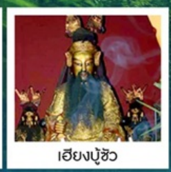
เฮียงปู้ซิว