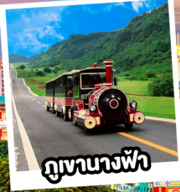
ภูเขาทางฟ้า