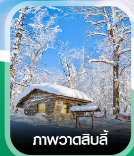
ภาพวาดสีบลู