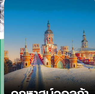
คฤหาสน์วอลก้า