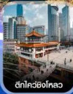
ตึกไควซิงโหลว