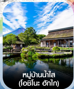
หมู่บ้านน้ำใส (โอบิโนะ อักโก)

✈️ คอนเฟิร์มออกเดินทาง ทุกพีเรียด 2 ท่านขึ้นไป