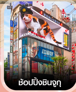
ช้อปปังชินจูกุ

คอนเฟิร์มออกเดินทาง ทุกพีเรียด 2 ท่านขึ้นไป