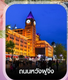
ถนนหวังฟู่จิ่ง

✈️ คอนเฟิร์มออกเดินทาง ทุกพีเรียด 2 ท่านขึ้นไป