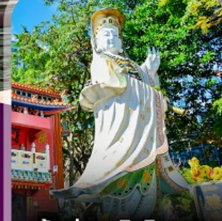
เจ้าแม่กวนอิมรินทะเล