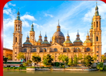
มหาวิหารแม่พระแห่งเสาคักดีสิกรี