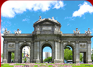
เช็ควินประตูอัลกาลา มาดริด