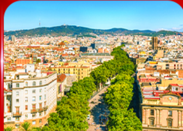
ลาริมบลาสตริก บาร์เซโลนา