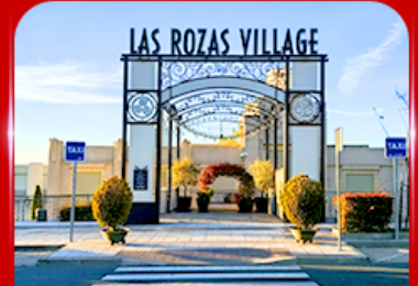
Las Rozas Village เอากีเลียน