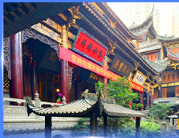
วอพรวัดหลิวฉัน ฉงชิ่ง