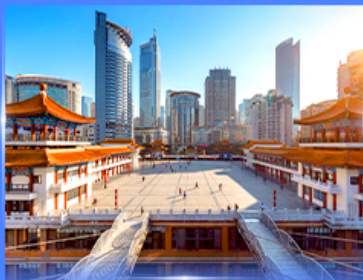
เข็ควิน ตึกโค่วซิงโห