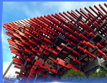
แลนด์มาร์คดัง ตึกตะเกียบ