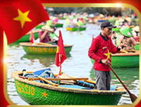
เรือกระด้ง หมู่บ้านกัมทาน