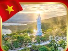
หอพระกวนอิม วัดหลินอึ้ง