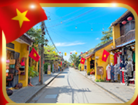
เมืองมรดกโลก ฮอยอัน