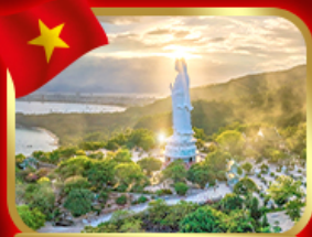
ขอพรกวนอิม วัดหลินอิ่ง