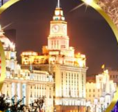
เดอะดอร์เซต