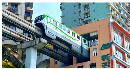
รถไฟฟ้าลัด