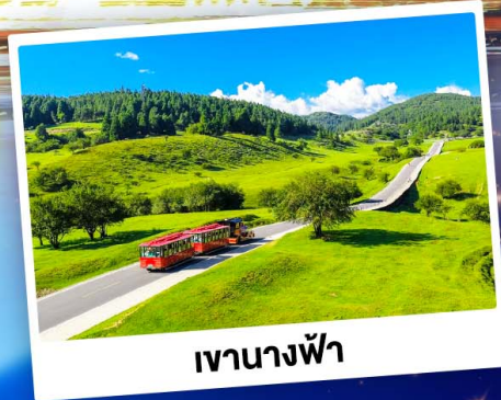
เจานางฟ้า