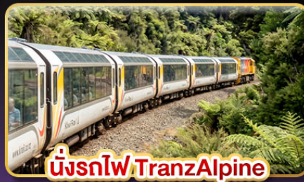
นั่งรถไฟ TranzAlpine