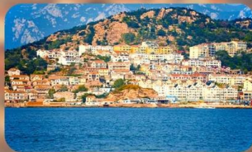
หมู่บ้านชาวประมงชาจื่อโจว