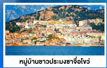
หมู่บ้านชาวประมงซาจื่อโจว