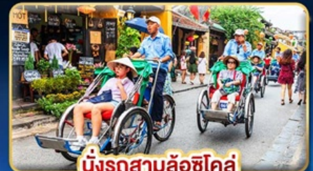
นั่งรถสามล้อฮิโคล์