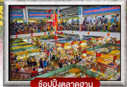
ซ้อปั้งตลาดฮาน