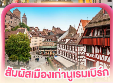
สัมผัสเมืองเก่าบูร์ก