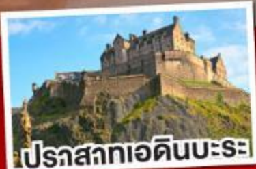
ปราสาทเอ็ดินบะระ