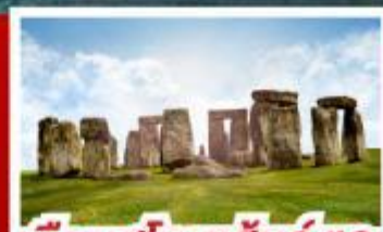
เขื่อนสโตนเฮ็นจ์ และ พิพิธภัณฑที่โรมันบาร