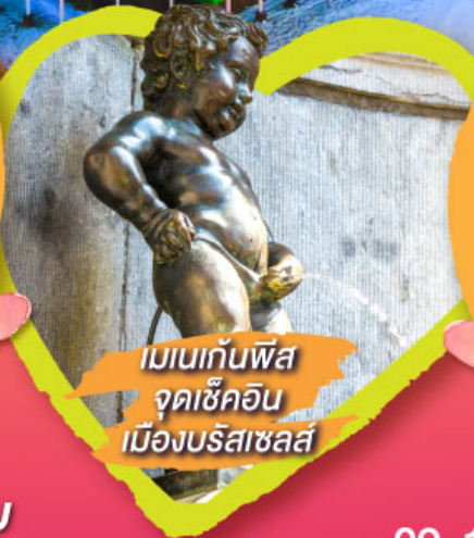
เมเนกันพิส จุดเช็คอิน เมืองบริสเซลส์