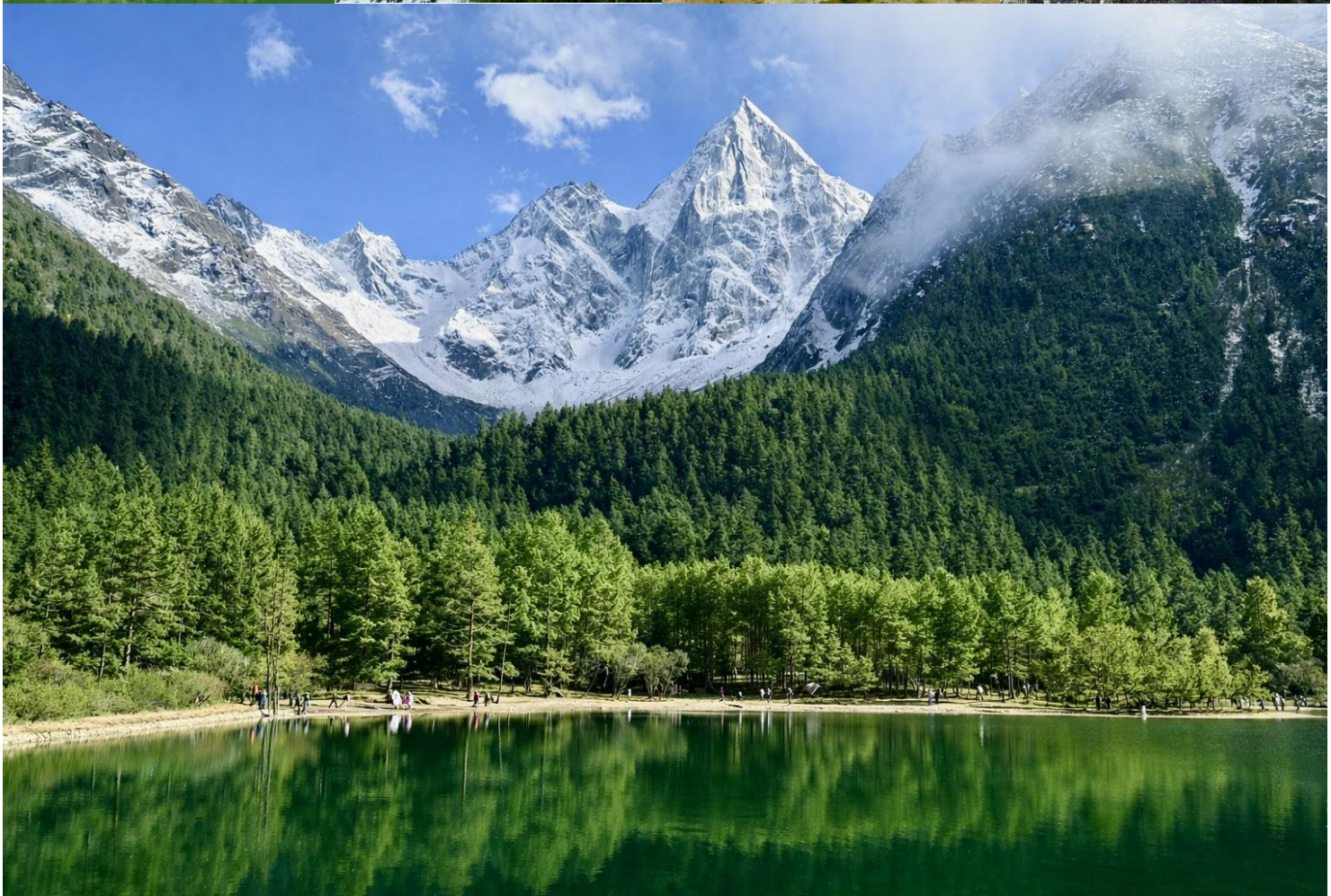
GO1TFU-SL020 เฉิงตู ฉงชิ่ง มรดกโลกพระหินแกะสลักต้าจู๋ อุทยานหลุมบ่อฟ้า อุทยานเขานางฟ้า อุทยานภูเขาสี่ตระกูล อุทยานปีเฟิงโกว (นั่งรถไฟความเร็วสูง) *ไม่ลงร้านช้อปปิ้ง* 7วัน 6คืน โดยสายการบิน Thai Lion Air (SL)