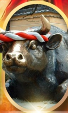
ศาลเจ้าคาไซฟู