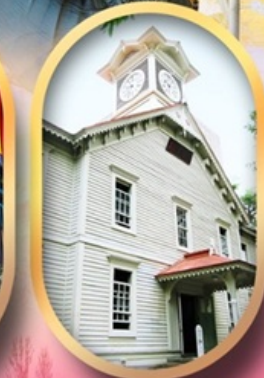
ผ่านชมหอนาฬิกา