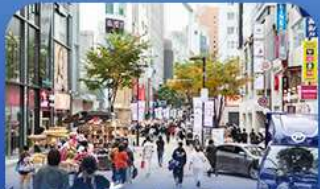
ช้อปปิงข่านเมียงดง