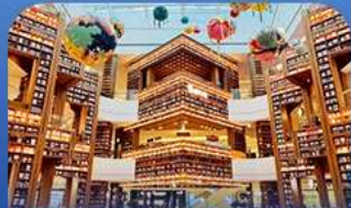
ต๋องกมุดคตาร์ทพีค