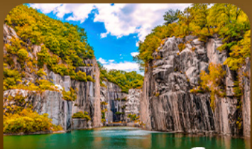
เขตเขาตึกปะเมืองโพซอน

ตามหาใบไม้เปลี่ยนสีสุดโรแมนติก ชมวิวแม่น้ำหลายสีจากสะพานแวนูรูปตัว Y แห่งเมืองโพซอน สัมผัสความงดงามของโพซอนอาร์ทวอล์ก • เดินเล่นท่ามกลางต้นแปะทิวและแม่น้ำโพซอนราชวังเคียงบกกรุงโซล ชมหมู่บ้านอันอกกลางบรรยากาศย้อนยุค และปิดท้ายด้วยทุ่งหญ้าสีทอง ณ สวนฮานิลแลนด์มาร์กยอดนิมของกรุงโซล ในช่วงฤดูใบไม้เปลี่ยนสีที่สวยงามที่สุด