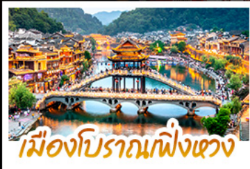
เมืองโบราณเฟิงเตา