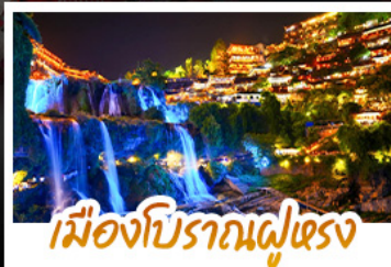
เมืองโบราณผู่เฉิง