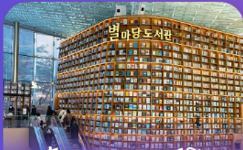
ต่องสมุดสตาร์ฟิลา

เก็บทุกไฮไลท์ ในกรุงโซล ตั้งแต่ความงดงามของ พระราชวังเคียงบ็อก ชมวิวสุดอลังการที่ ดึงลือตเต็ โซลสกาย (รวมค่าลิฟต์ขึ้นดึก) สนุกสุดมันส์ที่ สวนสนุกลือตเต็ เวิร์ล (รวมค่าบัตรเครื่องเล่น) พลิตเพลนไปกับโลกใต้ทะเล ลือตเต็ อควาเรียม (รวมค่าบัตรเข้าชม) เช็กอินแลนด์มาร์กสุดฮิตอย่างห้องสมุดสตาร์ฟิลา โคเอกมอลล์ เดินเล่นย่านฮิป บรูกลินกาหลี ซองชุง และช้อปปิ้งซัมเมอร์ชิล สุดฟิน ย่านเมียงดงและฮงแด