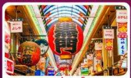
ตลาดปลาคุโรมง