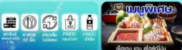
เช็ทซาฮู ซาฮู สไตล์ญี่ปุ่น