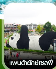
แพนด้ายักษ์เซลฟ์

✈️ คอนเฟิร์ม ออกเดินทาง ทุกพีเรียด 2 ท่านขึ้นไป