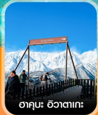
ฮาคูบะ อิวาตาเกะ