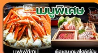
บุฟเฟ่ต์ซาปู เซตซาปู ซอสต์ญี่ปุ่น

นั่งกระเช้าฮาคูบะ-อิวาตาเกะ-คามิโคจิ-ฟูจิ-คารุชาว่ำปรีนซ์-อีสระซ้อปปิงโตเกียว-กินบุฟเฟ่ต์ซาปู-พักออนเซ็น