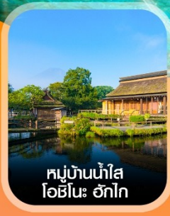
หมู่บ้านน้ำใส โอชิโนะ ฮักไก

✈️ คอนเฟิร์ม ออกเดินทาง ทุกพีเรียด 2 ท่านขึ้นไป