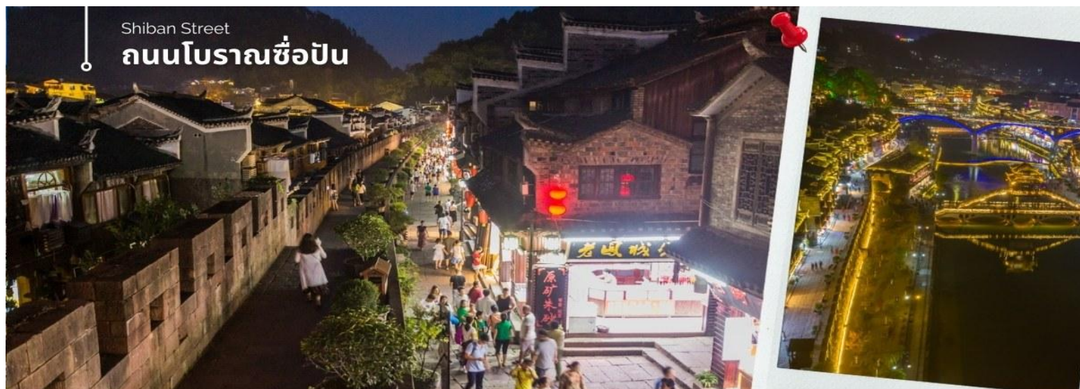
Shiban Street ถนนโบราณชือป๋าน

นำท่านเดินทางโดยรถโค้ชปรับอากาศเข้าสู่ เมืองโบราณเฟิ่งหวง (เมืองหงส์) ใช้เวลาเดินทางประมาณ 3 ชั่วโมง เดินทางถนนโบราณ Feng Huang Ancient Town ที่ถนนชือป๋าน Shiban Street เมืองที่ยังคงรักษาเอกลักษณ์ความเป็นพื้นเมืองผสมผสานกับยุคปัจจุบันเอาไว้ได้อย่างลงตัววิถีชีวิตของชาวบ้านที่อาศัยอยู่ที่นี่ บรรยากาศในเมืองเฟิ่งหวง ถนนเก่าชือป๋านเป็นถนนปูหินแคบๆ กว้างไม่ถึง 5 เมตร ทอดยาวจากทางเข้าวัดเต้าเหมินไปทางทิศตะวันตก ผ่านถนนหลายสาย ได้แก่ ถนนนครอส ถนนเจิ้งตะวันออก ถนนเจิ้งตะวันตก ศาลาฮุยหลง หียงเซียวซง เต้าซานลา ศาลาเจี๋ยกั๋ว และสุสานเซินฉงเหวิน สุดท้ายจะนำไปสู่ “น้ำพุแรกไต้ฟ้า” ถนนสายนี้มีความยาวกว่า 3,000 เมตร และเป็นย่านการค้าที่คึกคักที่สุดในเฟิ่งหวง