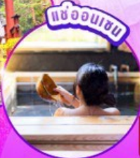
แช่ออนเซน