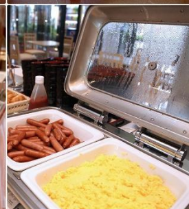
Asia Narita Hotel