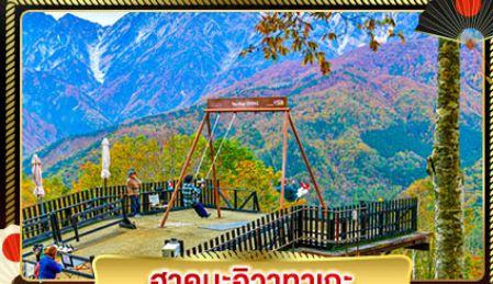
ฮาคูะอิซากาตะ