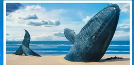
ชายหาดวาฬโดดเดี่ยว