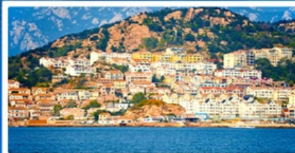
หมู่บ้านชาวประมงซาจ้อโจว